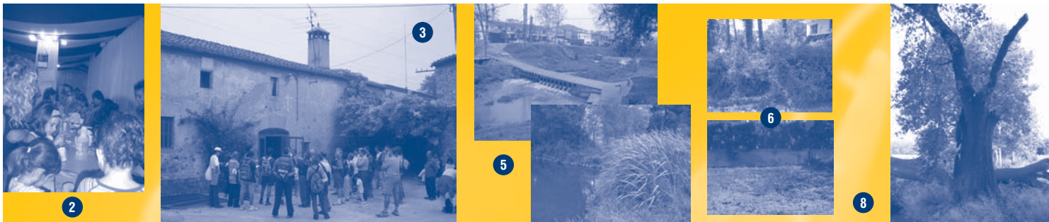
butlletí quinzenal d'informació municipal de l'Ajuntament de Lliçà d'Amunt / 1 d'octubre de 2004